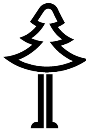
Ryc. 1. Logo wrocławskiego programu i kampanii zdrowotnej

Działaniem promującym program oraz zwracającym uwagę na konieczność dbania o prawidłową postawę ciała u dzieci jest kampania „Trzymaj się prosto”. Uczestniczyli w niej lekarze, fizjoterapeuci i pielęgniarki, organizując darmowe prelekcje z zakresu diagnostyki oraz leczenia zachowawczego dla rodziców, a także nauczycieli wychowania fizycznego na temat profilaktyki wad postawy. Podczas kampanii zdrowotnej były organizowane m.in. konferencje prasowe zawierające: pokazy gimnastyczne, artystyczne, szkolne kon-